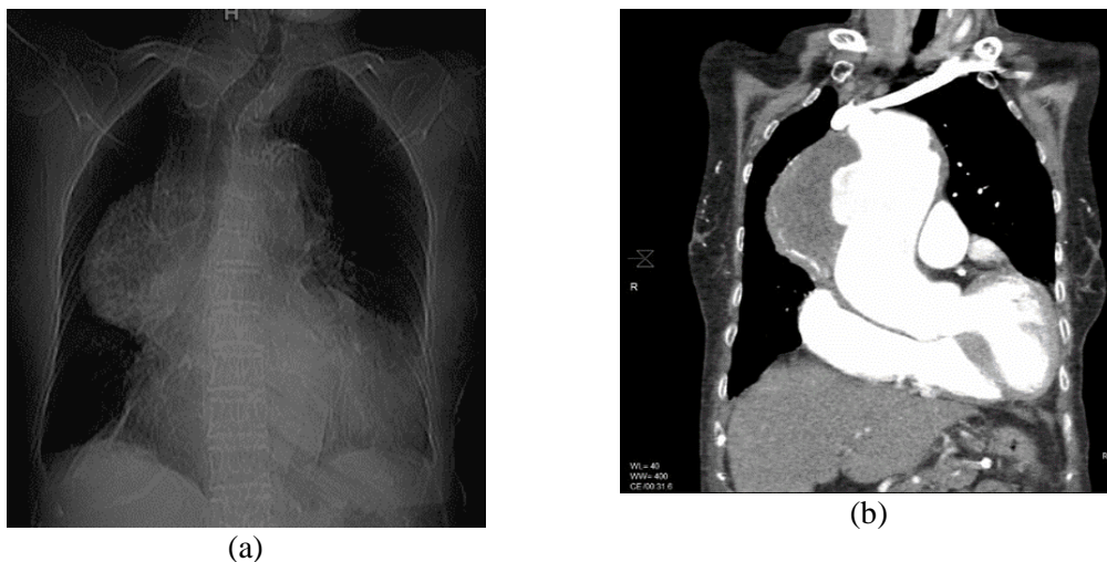
Gambar 3. Hasil radiograph Toraks (a) Kontras potongan coronal (b)