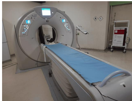
Gambar 1. Pesawat CT Scan Tosiba Aquilion Prime 160 Slice

Penelitian dilaksanakan pada bulan Maret 2023 di Instalasi Radiologi RS Al Islam Bandung, menggunakan pesawat CTScan merk Toshiba Aquilion Prime 160 slice. Tipe/SN: MCS-7178A/10476-8N.